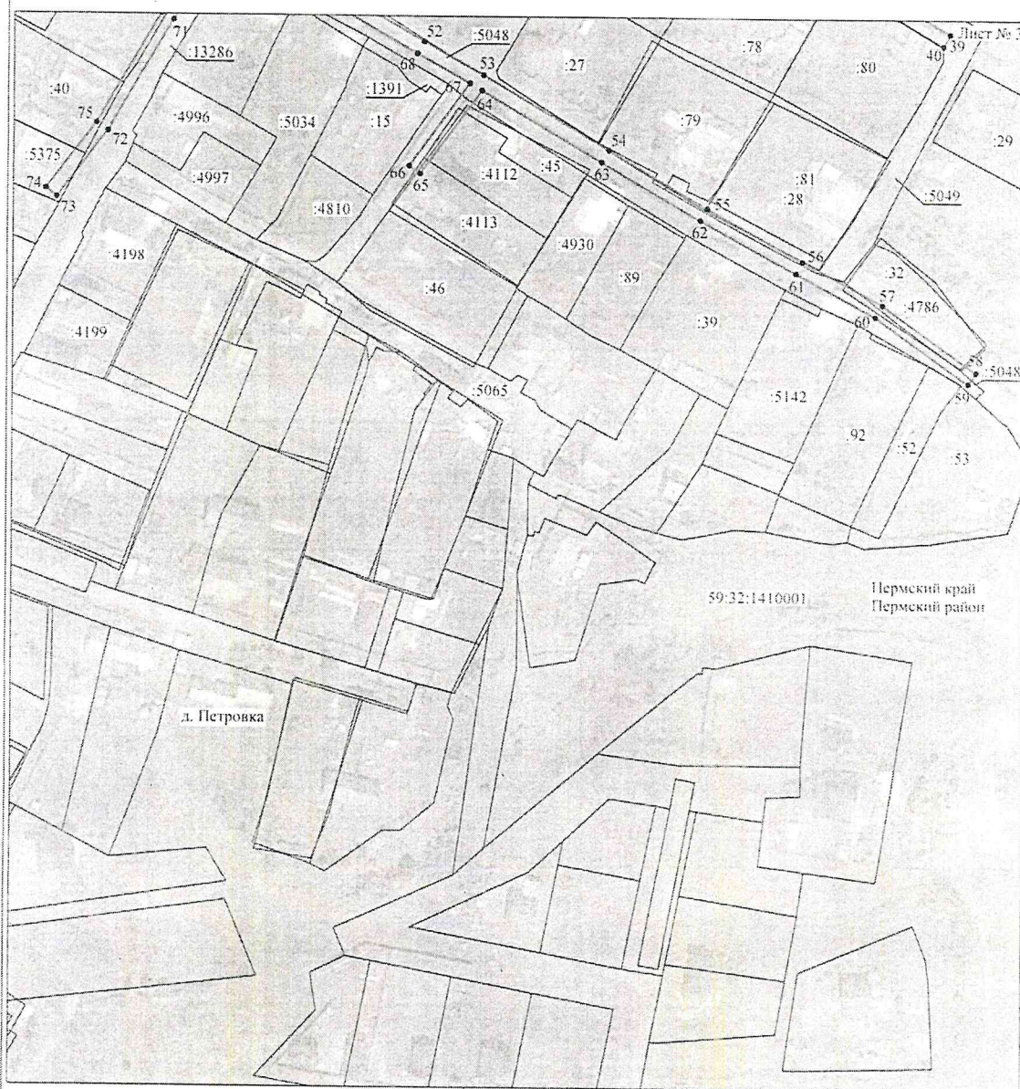
Схема расположения границ публичного сервитута объекта